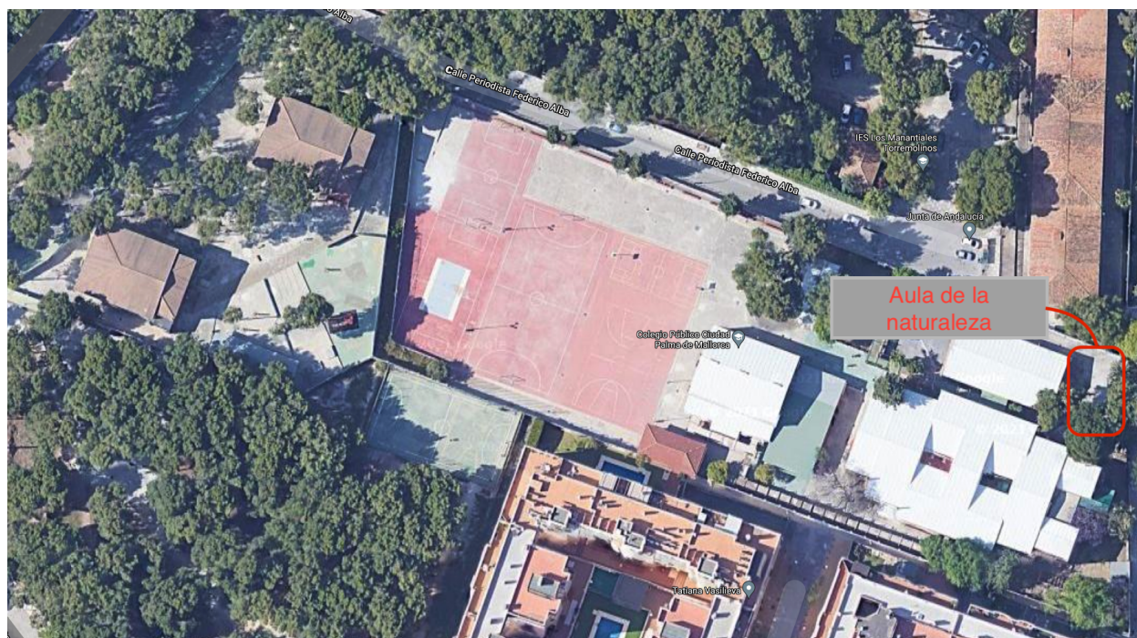
Vista de satélite del lugar especificado para el aula de la naturaleza