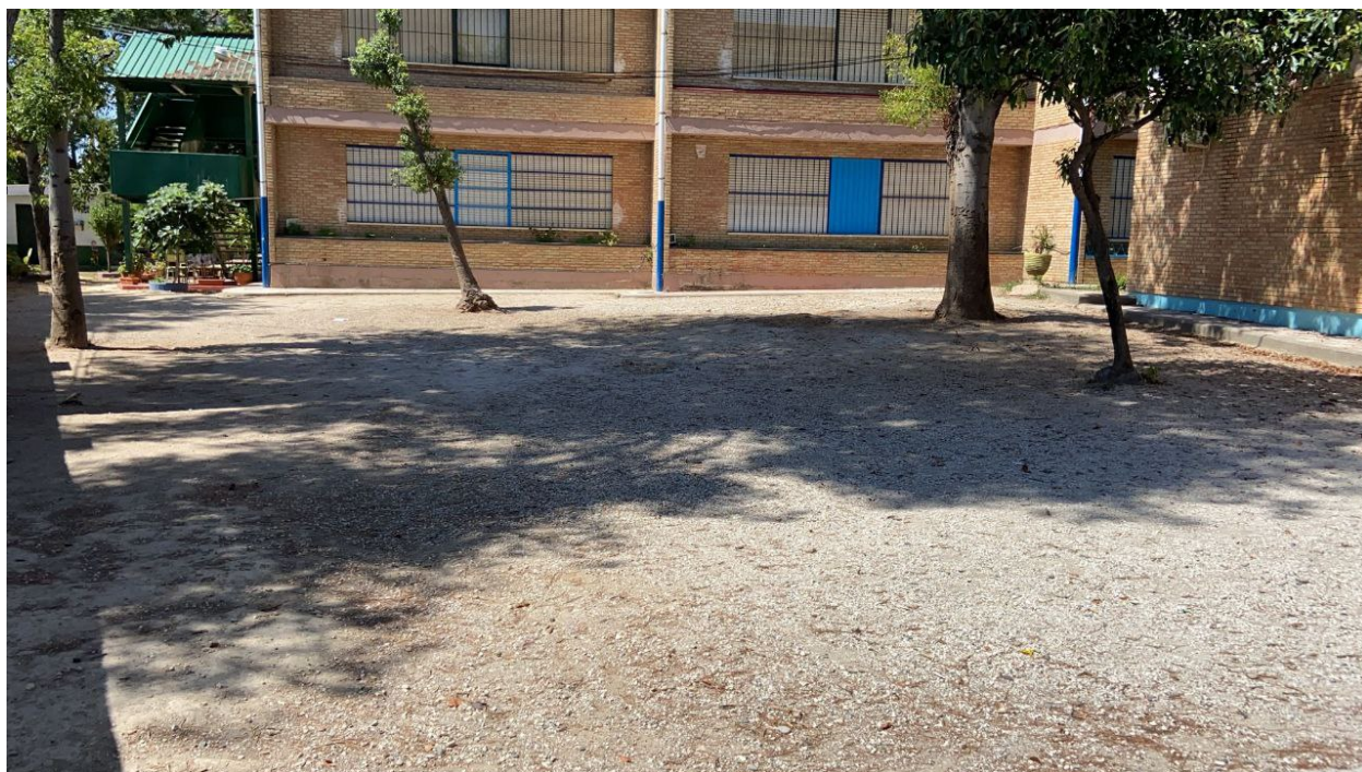
Vista desde muro exterior, edificio de biblioteca a la derecha de la imagen, edificio de primaria junto al huerto urbano al fondo.