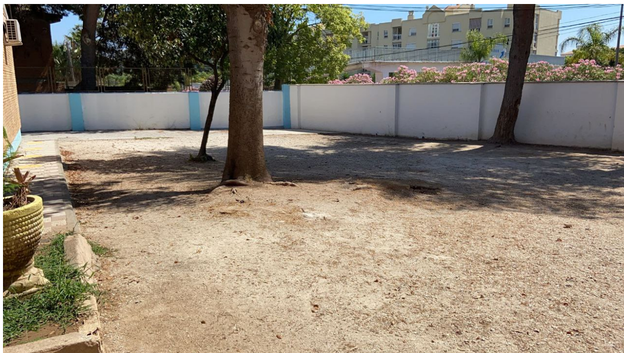
Vista desde el pasillo del edificio de administración.